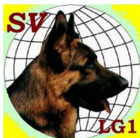
Seit dem 28.06.2000 im Web-Netz

Herzlich Willkommen ● LG1-Aktuell ● Der LG-Vorstand informiert